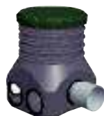
BOITE DE REPARTITION

Simplifiez vous la vie : Utilisez nos Géokits (Préalablement découpés, en fonction de la superficie réglementaire)