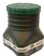
BOITE DE BOUCLAGE