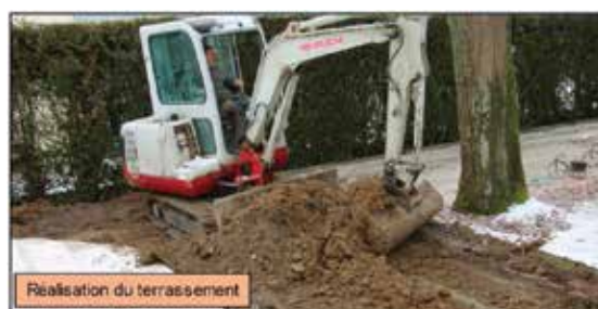
Réalisation du terrassement