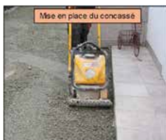
Mise en place du concassé