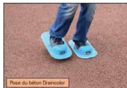
Pose du béton Draincolor