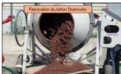
Fabrication du béton Draincolor