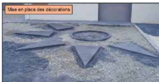
Mise en place des décorations