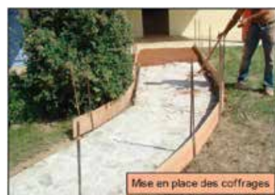
Mise en place des coffrages