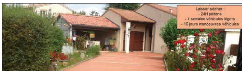
Laisser sécher : - 24H piétons - 1 semaine véhicules légers - 10 jours manoeuvres véhicules