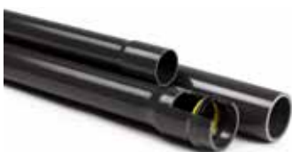
Tube PVC pression Ø16-400 PN10/ 16/20/ 25

Avec une bague en inox supplémentaire, le raccordement de tube pvc est possible.