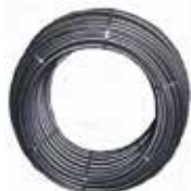
Tube PEHD bande Blanche IRRIGATION Ø20-315 PN10/ 12.5/ 16